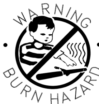
KEEP AWAY FROM CHILDREN

ВНИМАНИЕ – ЭТО УСТРОЙСТВО МОЖЕТ ВЫЗВАТЬ ОЖОГ ГЛАЗ